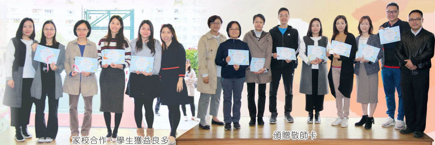
家校合作，學生獲益良多